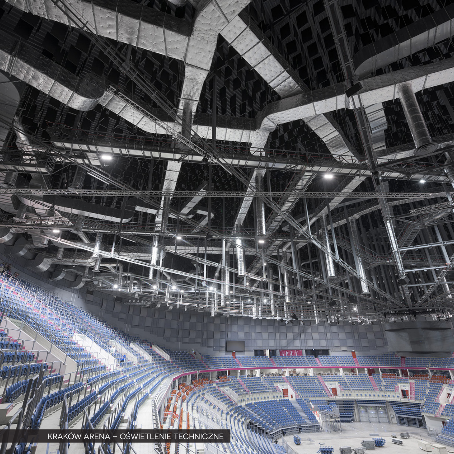
KRAKÓW ARENA – OŚWIETLENIE TECHNICZNE